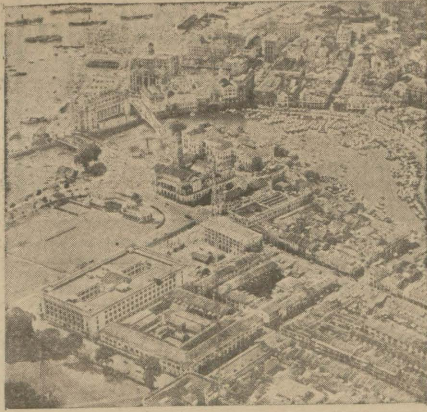
Singapur İmanından bir-görünüş

Buenos Aires, 2 (A.A.) — Beş haftadır Arjantin hükümet merkezinde dayanılmaz bir sıcak dalgası hüküm sürmektedir. Bilhassa evlerin içi oturulmaz hale gelmiştir. Sıcak dalgası hasebile bilhassa sayrüsefer polisleri arasında birçok güneş çarpması vak'aları görülmüştür.